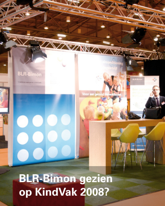
BLR-Bimon gezien op KindVak 2008?

Geen groep zo kwetsbaar als kinderen tussen de 0 en 4 jaar oud. Baby's en peuters zijn volop in ontwikkeling en extra vatbaar voor bacteriën en ziektekiemen.